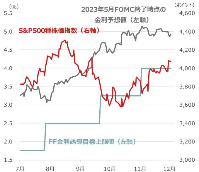
S&P500種株価指数・FF金利ピーク予想値・ FF金利誘導目標上限値

期間：2022年7月1日～2022年12月2日、日次 ・FF金利はフェデラルファンド金利 ・FF金利ピーク予想値は、FF金利先物から算出した2023年5月FOMC終了時点の金利予想値（2022年12月2日時点） （出所）Bloombergより野村アセットマネジメント作成