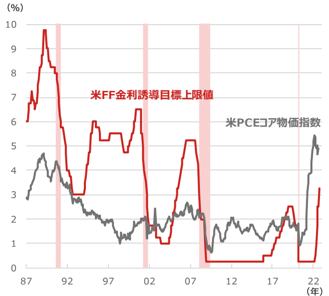
米FF金利誘導目標上限値と米PCEコア物価指数

期間：（米FF金利誘導目標上限値）1987年1月末～2022年10月25日、月次 （米PCEコア物価指数）1987年1月～2022年8月、月次 ・FF金利はフェデラル・ファンド金利 ・網掛けは米景気後退期