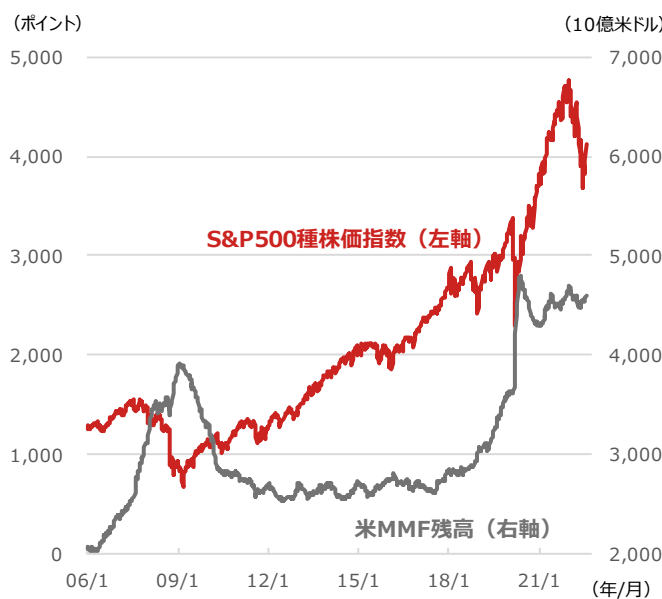
期間：（S&P500種株価指数）2006年1月6日～2022年8月1日、週次 （米MMF残高）2006年1月4日～2022年7月27日、週次 （出所）Bloombergより野村アセットマネジメント作成

*当資料は、一部個人の見解を含み、会社としての統一的見解ではないものもあります。