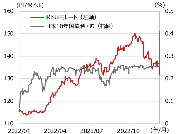
円の対米ドルレートと日本10年国債利回り

期間：2022年1月3日～2022年12月20日、日次