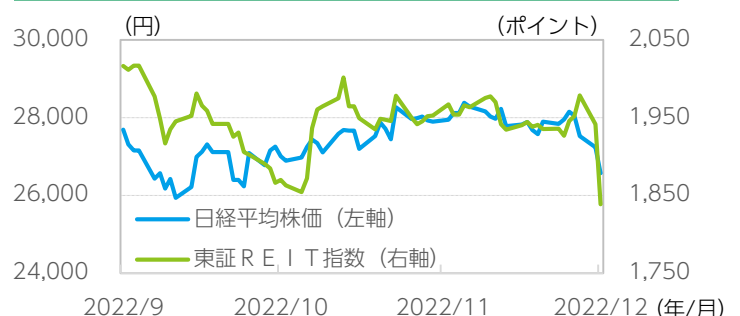
図表3：国内市場は前日比で大幅下落