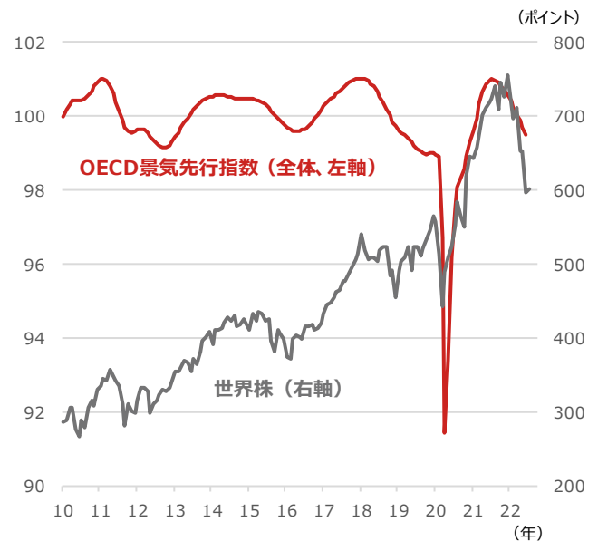
OECD景気先行指数と世界株

期間：（OECD景気先行指数）2010年1月～2022年6月、月次 （世界株）2010年1月末～2022年7月11日、月次 ・世界株はMSCI All Country World Index、米ドルベース