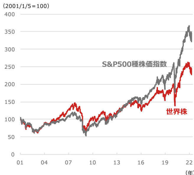
世界株とS&P500種株価指数

期間：2001年1月5日～2022年4月26日、週次 ・世界株はMSCI All Country World Index、米ドルベース