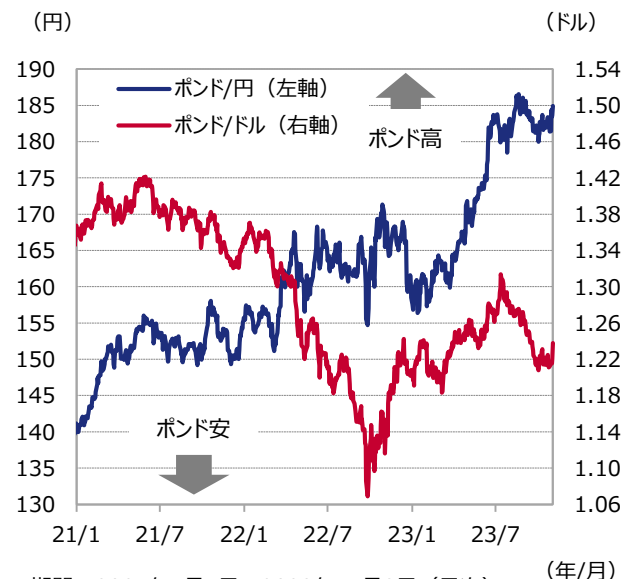
図表2 ポンドの推移

期間：2021年1月1日～2023年11月3日（日次）