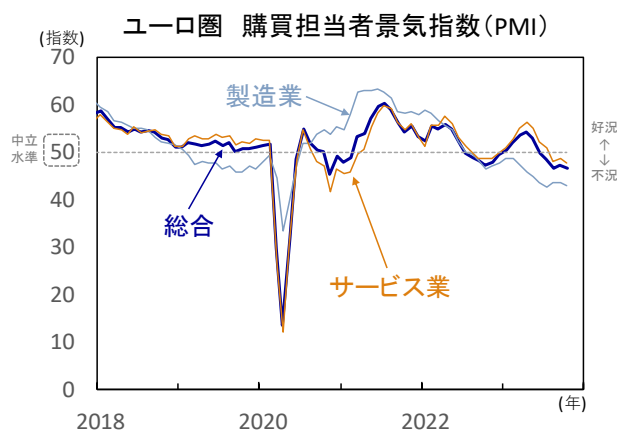
【図3】ユーロ圏 景況感は景気低迷の継続を示唆