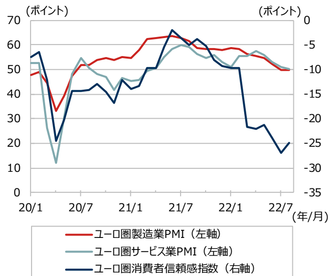
ユーロ圏PMIと消費者信頼感指数

期間：2020年1月～2022年8月、月次