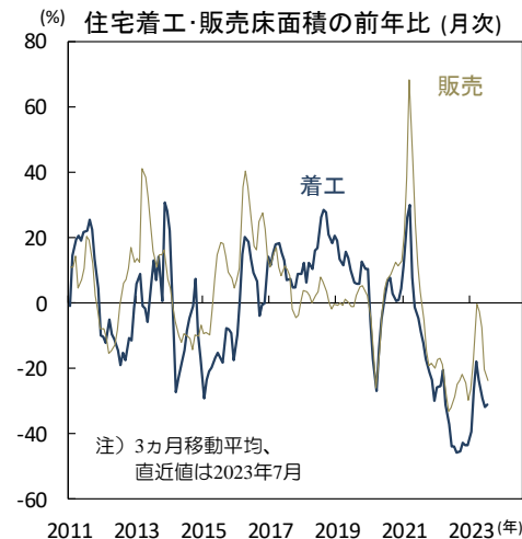
【図1】住宅販売と住宅着工は低迷を続ける

足元の景気指標は低迷しています。7月の不動産投資(名目、単月換算)は前年比▲12.0%(6月▲10.2%)へ下げ幅を広げ(図3)、製造業投資も同+4.3%(同+6.0%)、インフラ投資も同+4.6%(同+6.4%)へ鈍化。住宅不況に伴って地方政府の不動産関連歳入が低迷し地方政府系ノンバンク(融資平台)の財務状況も悪化しており、地方政府特別債という財源はあれど地方政府によるインフラ投資は勢いを欠いています。また、鉱工業生産は同+3.7%(同+4.4%)へ鈍化。輸出の落ち込みに加え、不動産投資の減速に伴う建材需要の低迷も重しとなりました。小売売上高(名目)も同+2.5%(同+3.1%)へ低迷。飲食サービス等が伸びたものの、住宅不況の影響で家具、家電製品、建材・装飾材など住宅関連が低迷を続けました。上記の月次景気指標が公表された8月15日、中国人民銀行は主要政策金利(1年物中期貸付制度:MLF)金利を引き下げ(2.65%→2.5%)。もっとも、不動産不況が引き続き重しとなり、景気は当面低迷を続けると予想されます。(入村)