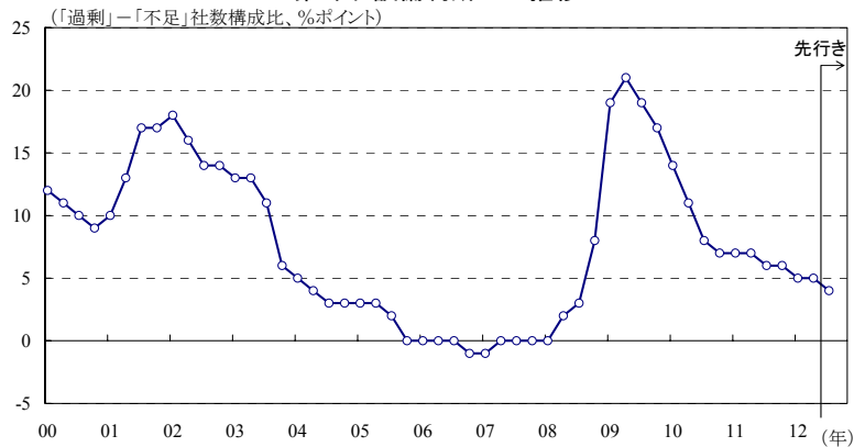
第2図:設備判断DIの推移

(注)全規模・全産業ベース。