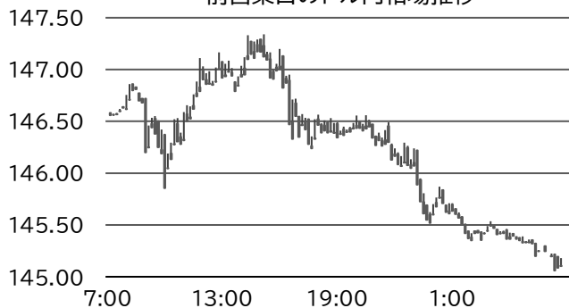
前営業日のドル円相場推移