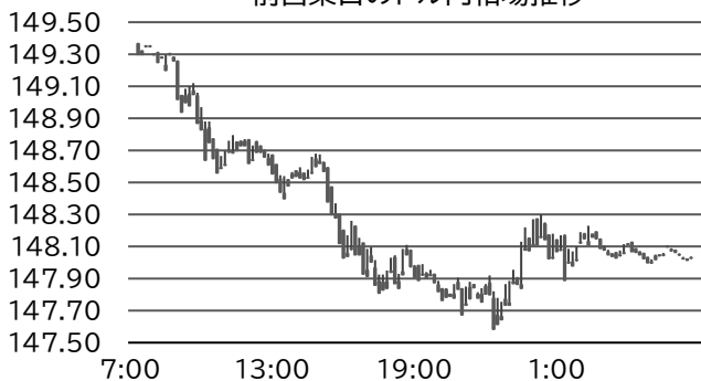
前営業日のドル円相場推移