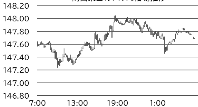
前営業日のドル円相場推移