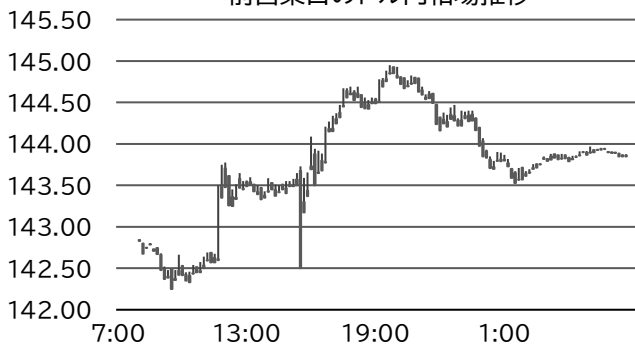
前営業日のドル円相場推移