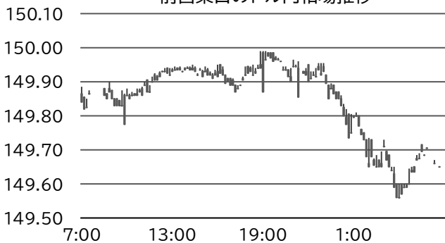
前営業日のドル円相場推移