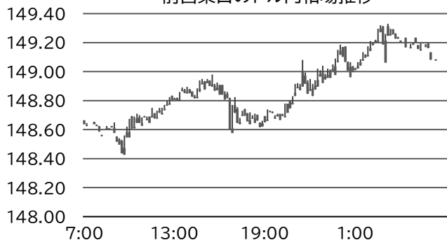
前営業日のドル円相場推移