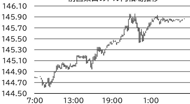
前営業日のドル円相場推移