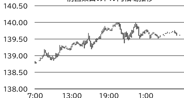
前営業日のドル円相場推移