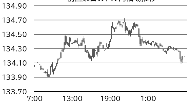
前営業日のドル円相場推移