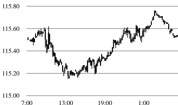
前営業日のドル円相場推移