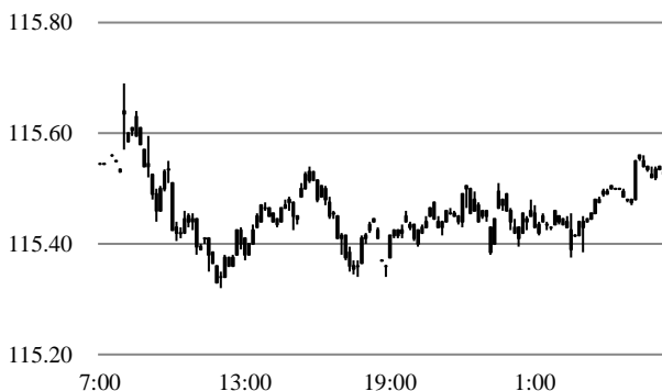
前営業日のドル円相場推移