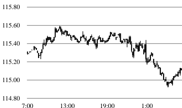
前営業日のドル円相場推移