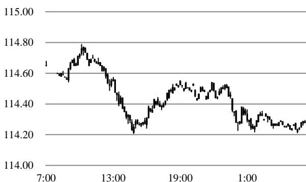
前営業日のドル円相場推移