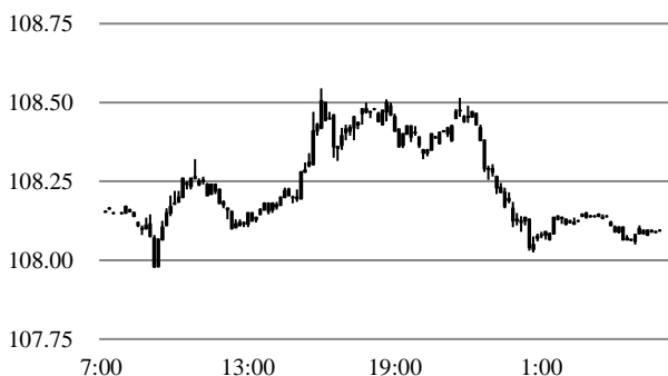
前営業日のドル円相場推移