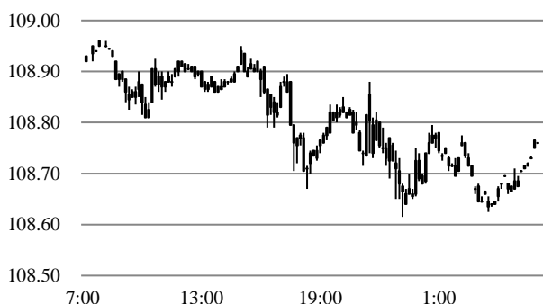
前営業日のドル円相場推移