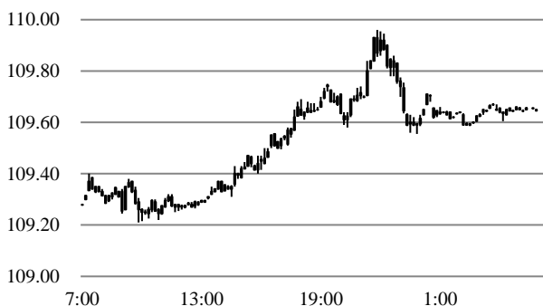
前営業日のドル円相場推移