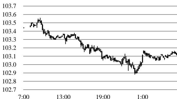
前営業日のドル円相場推移