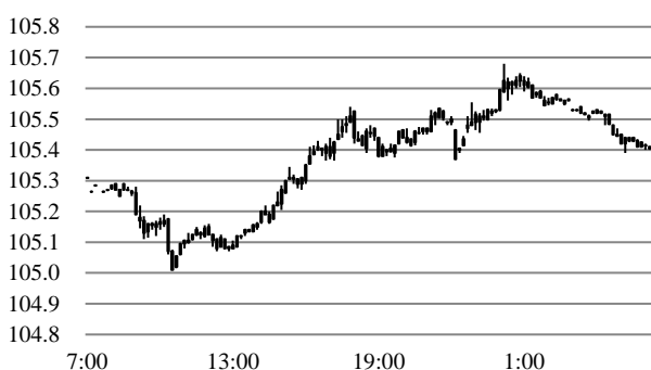
前営業日のドル円相場推移