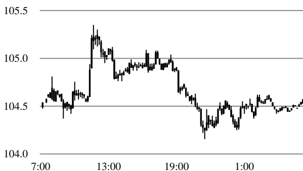
前営業日のドル円相場推移