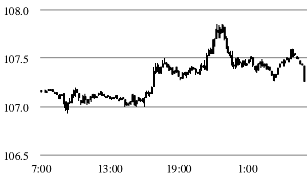
前営業日のドル円相場推移