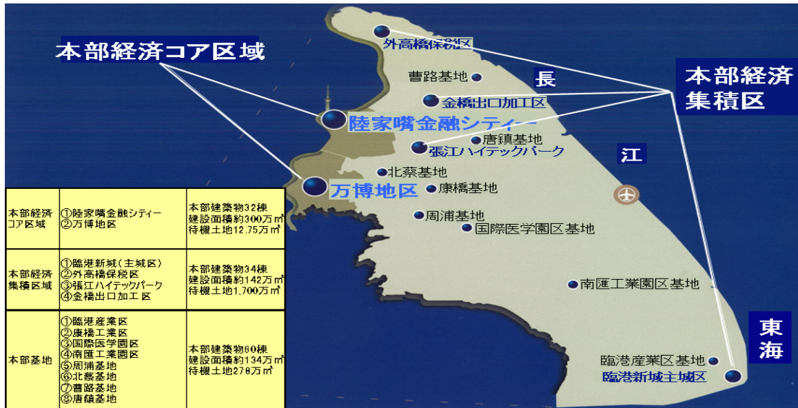
＜浦東新区地域本部の3Tier計画＞（図表1）