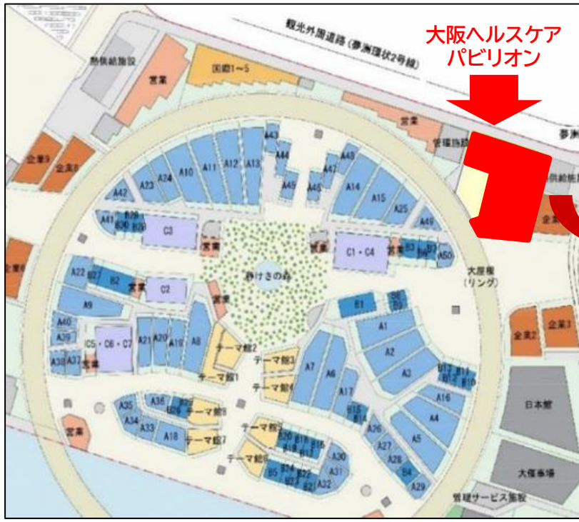
<大阪ヘルスケアパビリオン 位置図>