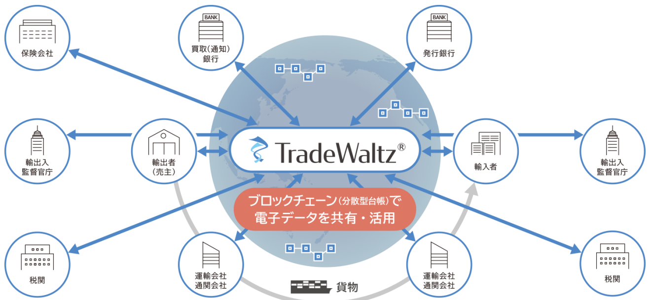
図2 TradeWaltz 導入後 業界横断で貿易業務を一元的に管理