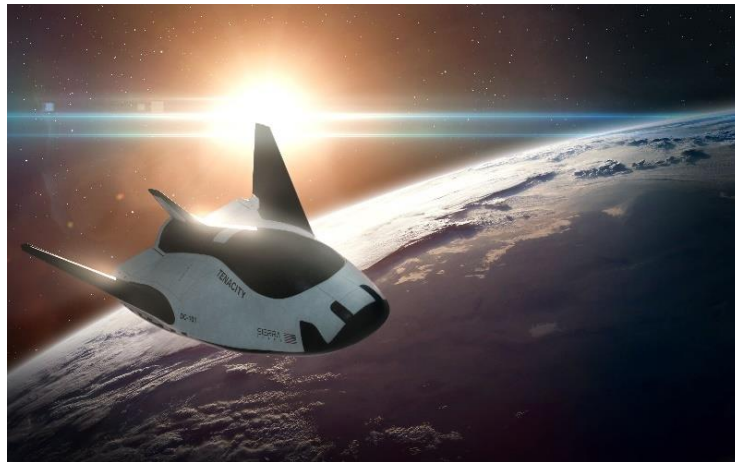
宇宙往還機 Dream Chaser イメージ

JAL、兼松、大分県、三菱 UFJ 銀行、東京海上日動、Sierra Space、Space Port Japan は、宇宙往還機 Dream Chaser®の活用検討に向けたパートナーシップ契約を締結しており、各者の連携のもと、大分空港を Dream Chaser のアジア拠点として活用することを目指し、実現に向けた取り組みを推進しています。