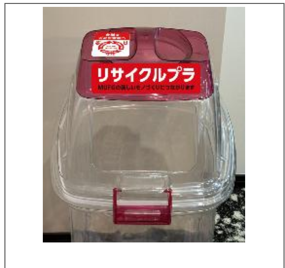
回収・分別を呼びかけるリサイクルボックス ※実装イメージ