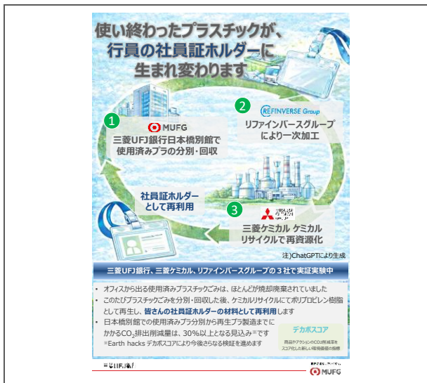
行内に掲示される啓発ポスター