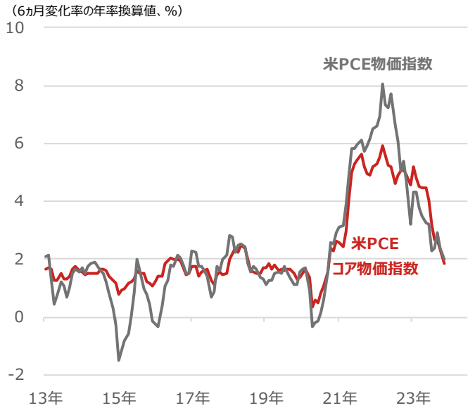
期間：2013年1月～2023年11月、月次