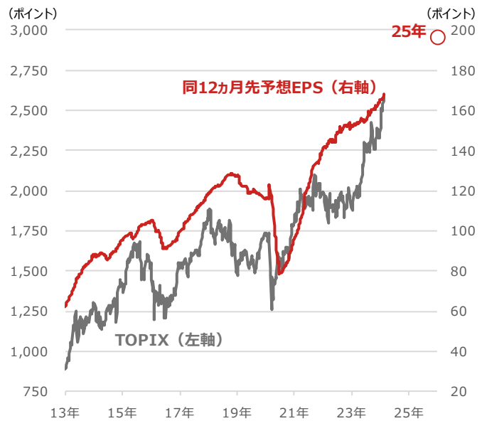
TOPIXと同12カ月先予想EPS（1株当たり利益）

期間：2013年1月4日～2024年2月14日、日次 ●印は2025年のBloomberg予想（2024年2月14日時点）