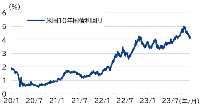
図表1 米国10年国債利回りの推移 (期間 2020年1月1日~2023年12月8日、日次)