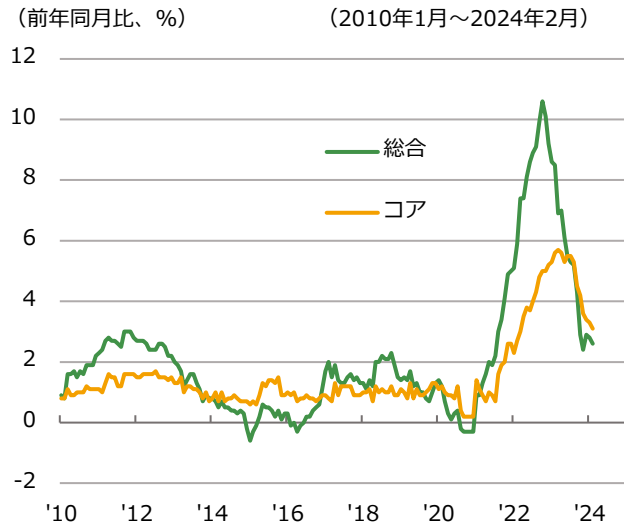
※コアは食品・エネルギー・アルコール・タバコを除く系列