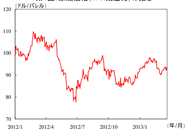
第1図: 原油価格 (WTI期近物) の推移

一方、サウジアラビアからの原油輸入の大半は中質中硫黄原油であり、シェールオイルとは品質が異なることから、代替する動きはみられない。米国のシェールオイル増産に伴う原油輸入減少が予想されているが、輸入相手国の原油の性質によって、その影響度合いは大きく異なっている。