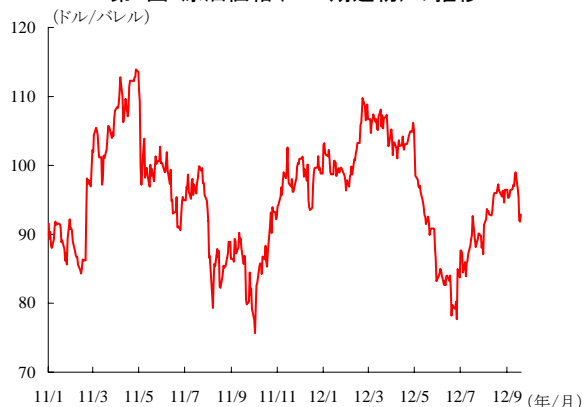
第1図：原油価格（WTI期近物）の推移

世界の原油需給バランスをみると、1～6 月期は大幅な供給超過（＝在庫積み増し）となっており、OPEC の産油量も高水準で推移している。深刻な供給不足は生じていないとみてよいだろう。しかしながら、需給逼迫に対する懸念が高まったことから、投機筋の買い越し額は急拡大し（第 2 図）、価格を押し上げたとみられる。足元の原油価格は下落しているが需給逼迫懸念は根強く、下値は限定的となろう。