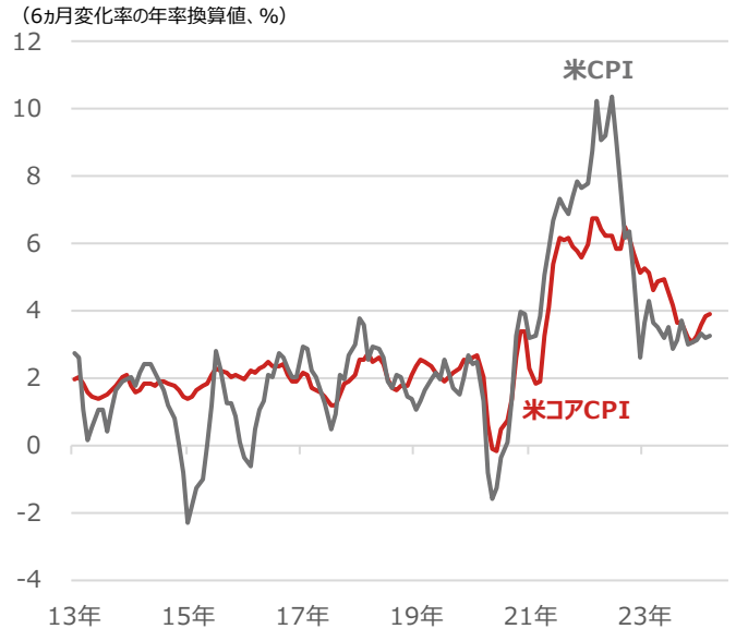
米CPI（消費者物価指数）とコアCPIの6か月変化率の年率換算値

期間：2013年1月～2024年3月、月次 （出所）Bloombergより野村アセットマネジメント作成