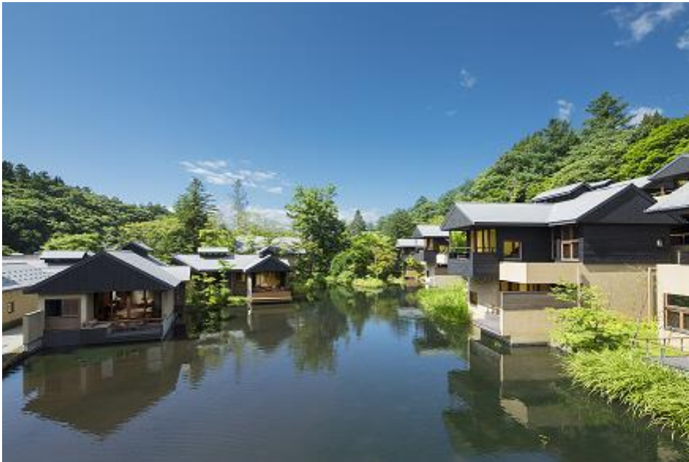
本物件① (星のや軽井沢)