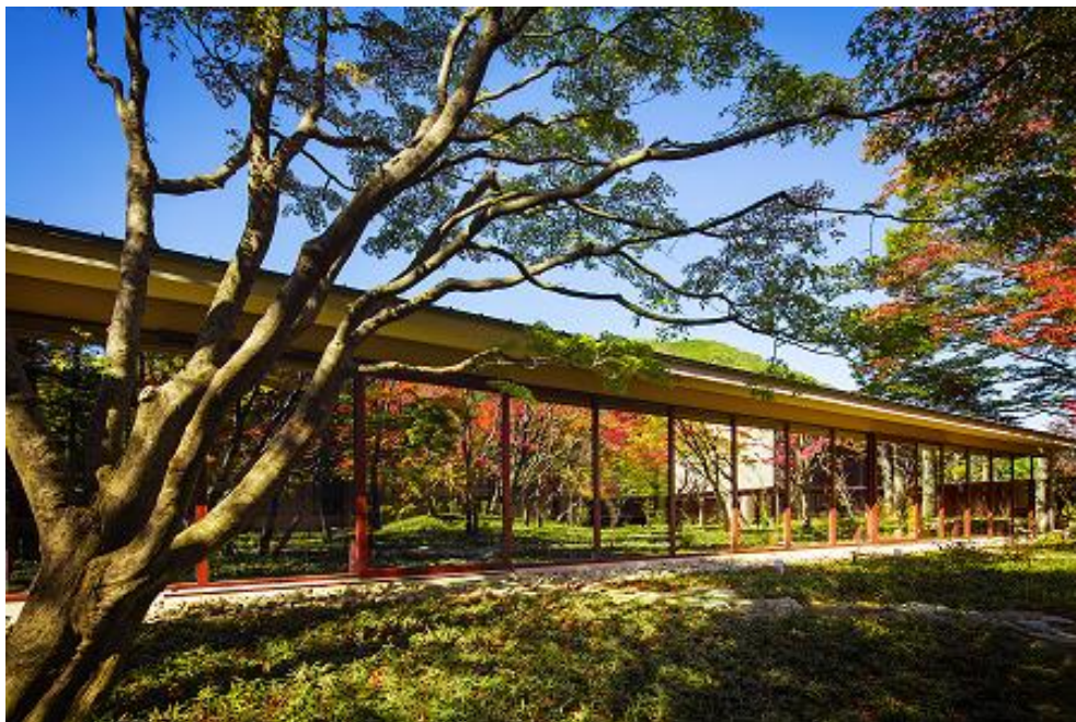
本物件② (界 鬼怒川)